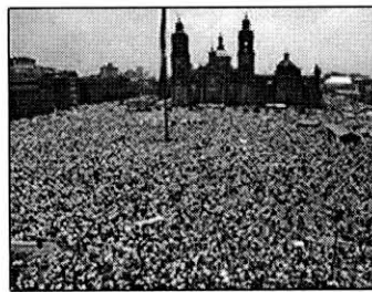
■ EL HIMNO NACIONAL une a los mexicanos