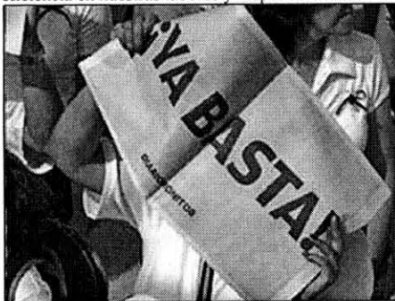
■ CONVICCIÓN se dieron cita desde muy temprana hora con un sólo propósito

Una mejor educación y ejemplo a los niños. Una mayor participación ciudadana en la solución de problemas comunes. Un mejor trato con nuestros vecinos y compañeros de trabajo. Una mayor eficiencia en nuestras labores y responsabilidades.